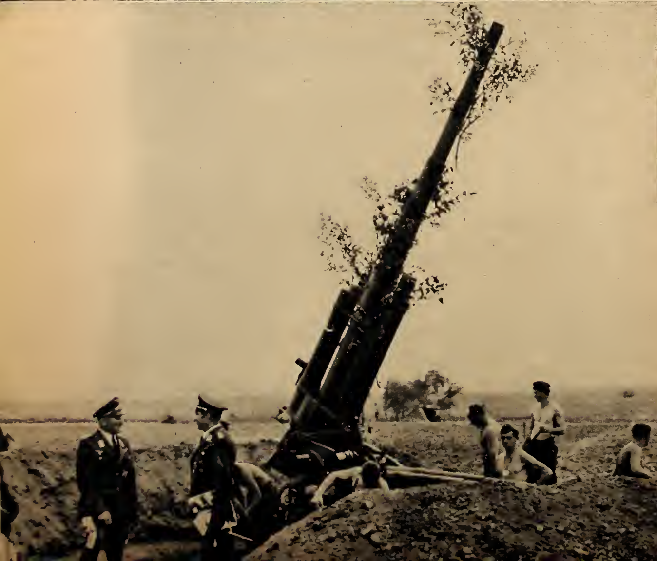
links: ... und Truppe — eine ... schaft. Generaloberst v. ... schisch besucht einen Flie- ... der siegreichen Luftwaffe